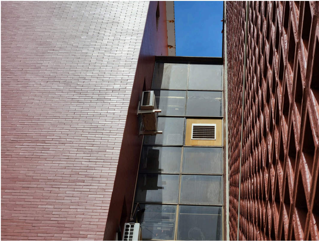
Imagem 07: Copa Prédio Sede 3º Andar