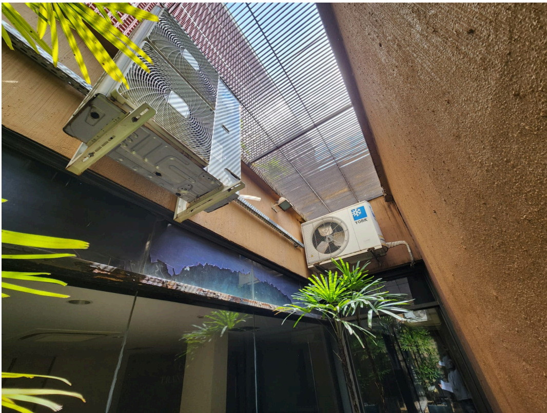
Imagem 13: Hall do Auditório.