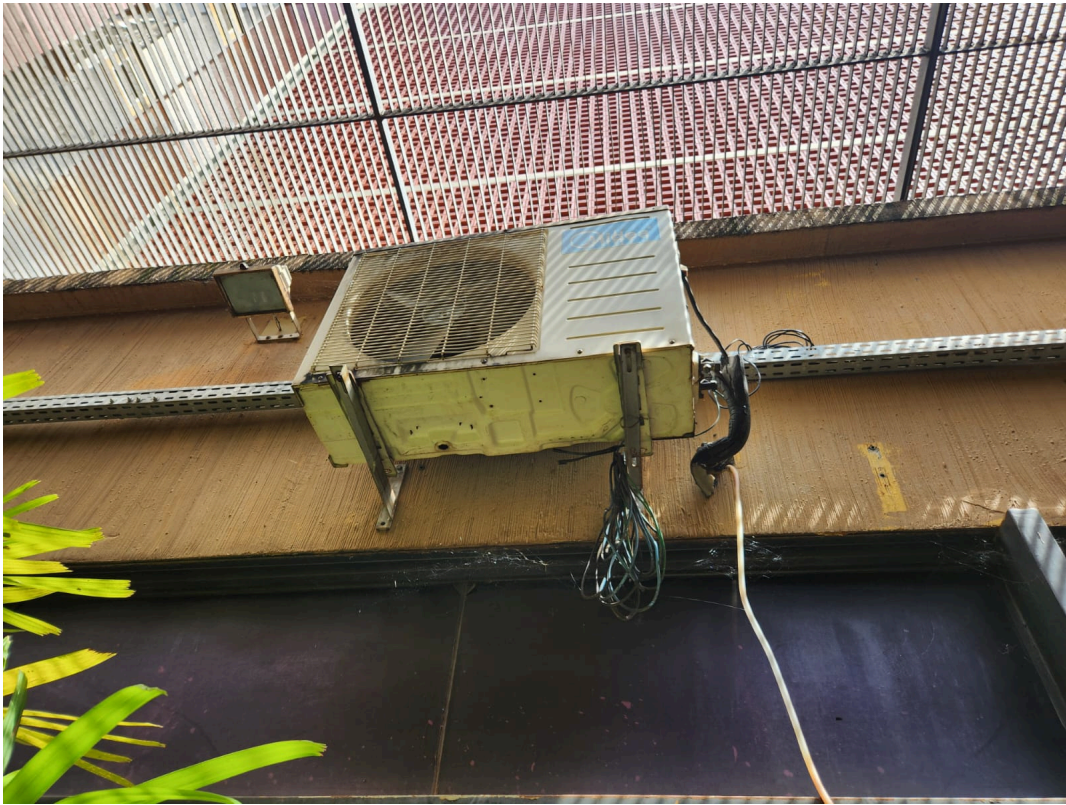
Imagem 05: Sala de Som do Auditório