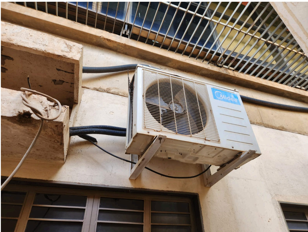
Imagem 02: Arquivo do Protocolo.