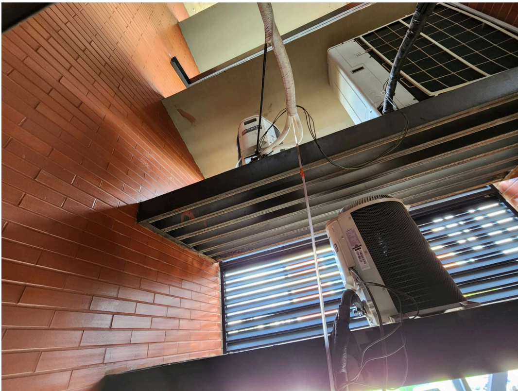
Imagem 06: Copa Prédio Sede Térreo e 2º Andar