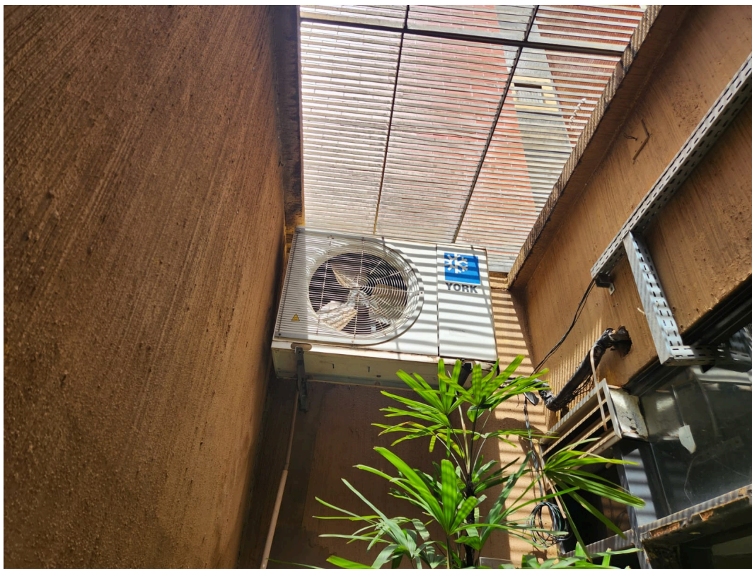
Imagem 14: Hall do Auditório.