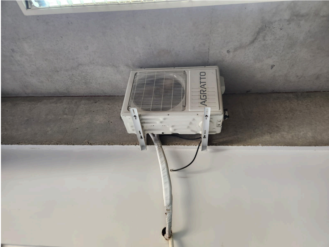
Imagem 01: Guaritas do Prédio Sede e Ruy Barbosa.