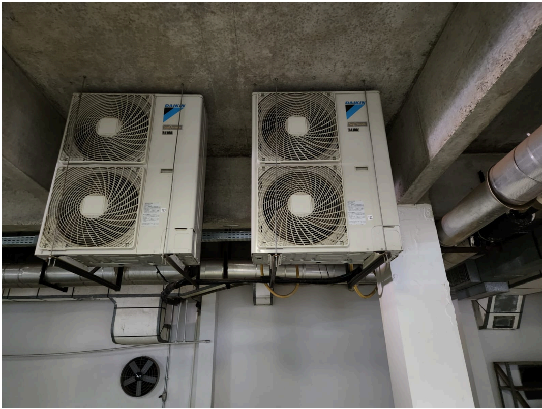
Imagem 12: Auditório.