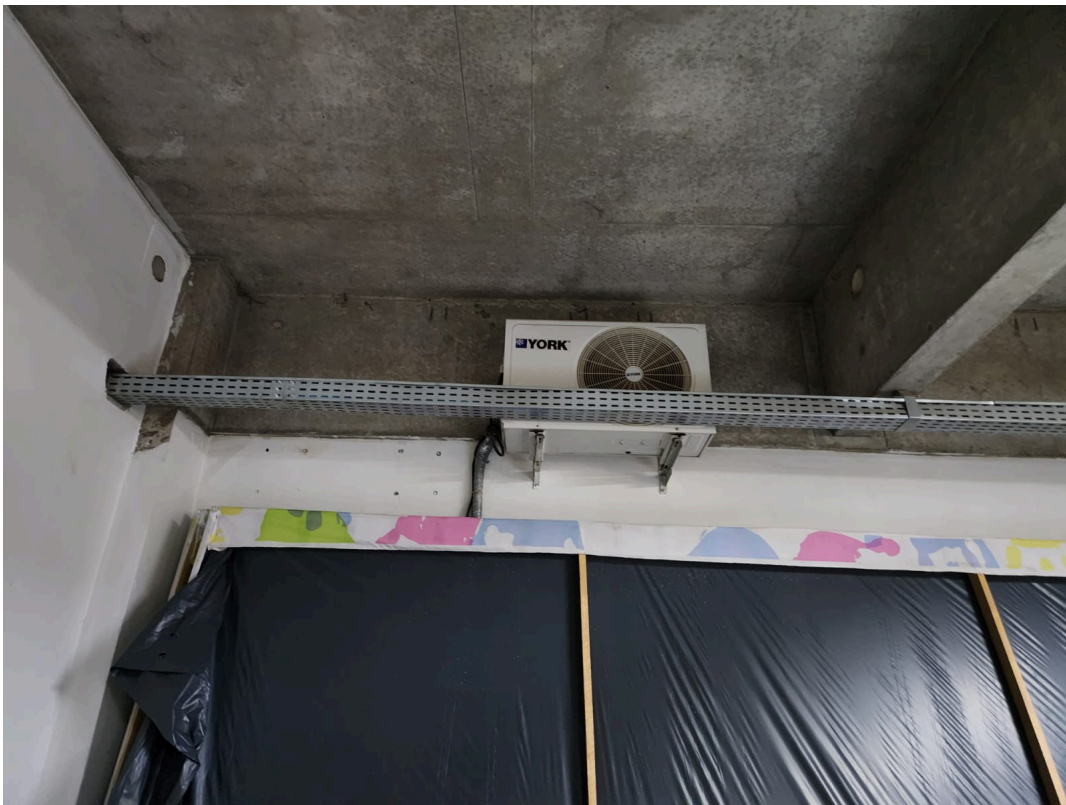
Imagem 10: Sala VIP do Auditório.