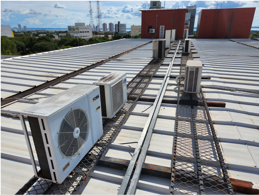
Imagem 09: As três salas da Diretoria Geral de Controle Externo.