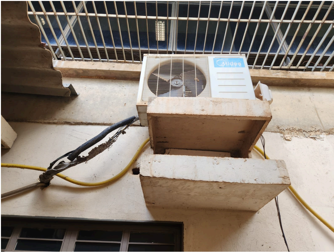
Imagem 03: Arquivo do Protocolo.