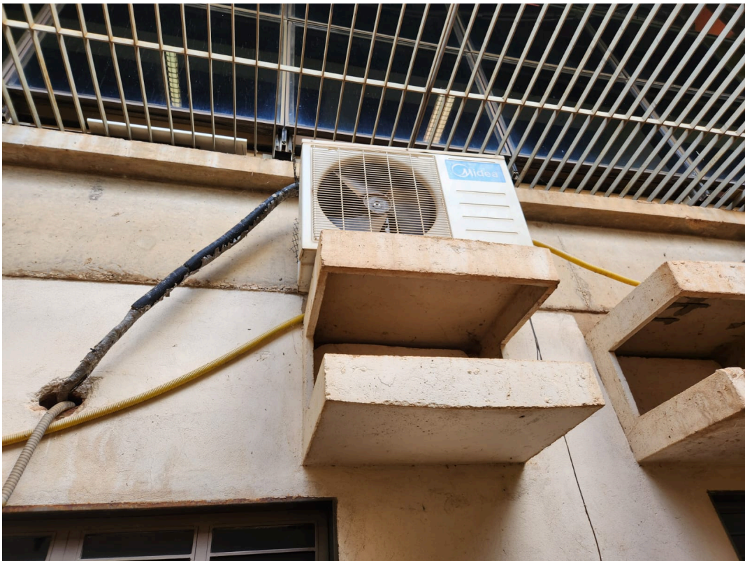
Imagem 04: